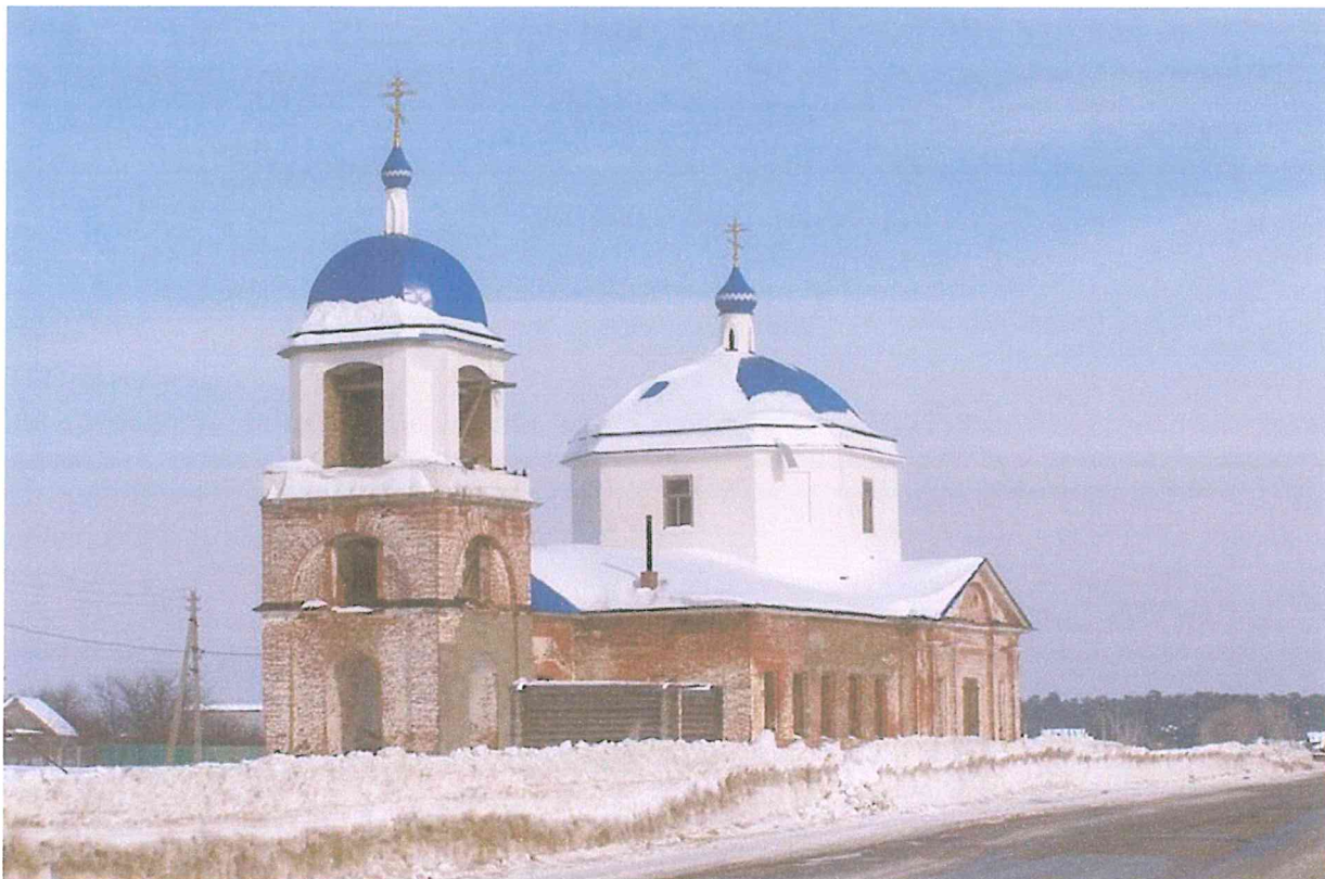
5. Храм Успения Святой Богородицы.