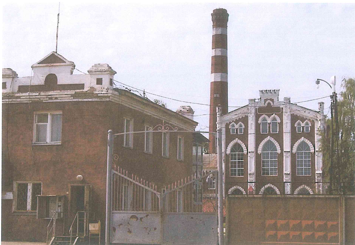
3. Здание спиртового завода.