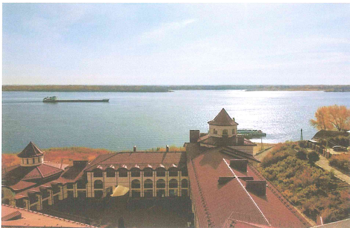
2. Вид с колокольни Казанского монастыря.