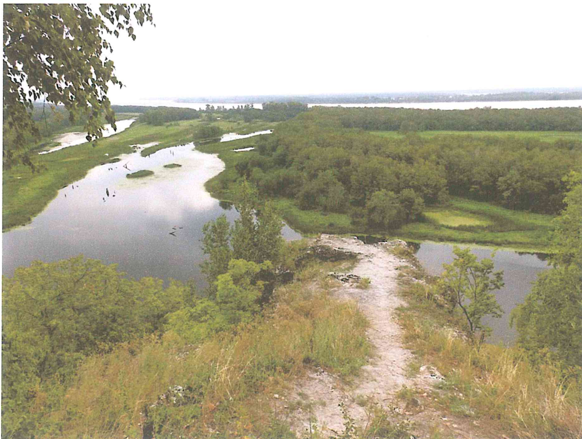
6. Вид с Вислого камня на Змеиный затон.