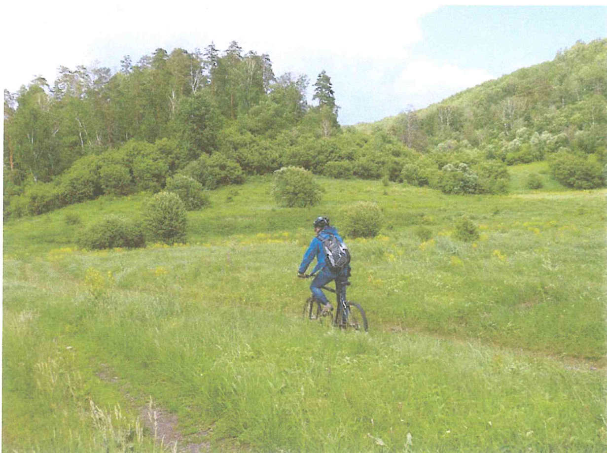
4. В оврагах Самарской Луки.