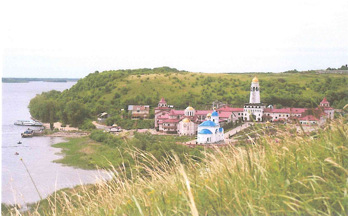
1. Монастырь в селе Винновка.